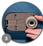
3 BUILT-IN AC PUMP

Construction avec profilé en wave Estructura wave-beam Wave-trägerkonstruktion Wave-balk constructie Costruzione wave-beam Konstrukcja wave-balk