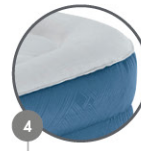
4 SURROUNDING FRAME

AC pompe intégrée AC bomba integrada AC integrierte pumpe AC ingebouwde pomp AC pompa integrata Wbudowana pompa AC