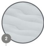
2 WAVE BEAM

Construction avec profilé en wave Estructura wave-beam Wave-trägerkonstruktion Wave-balk constructie Costruzione wave-beam Konstrukcja wave-balk